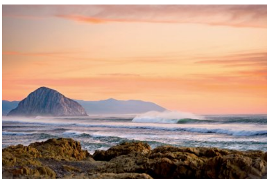
Bild 3 Seite 30-31 Kalifornien/USA, 2006