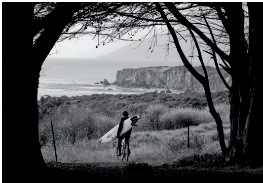
Bild 1 Seite 20-21 Kalifornien/USA, 2006