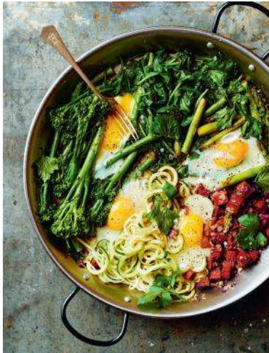
Bild 9 Seite 116 Grüne Schakschuka mit Sucuk