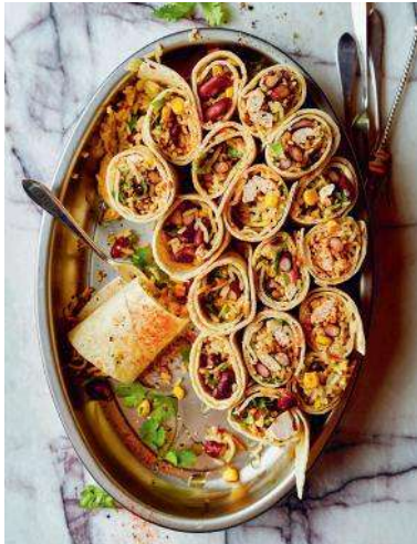
Bild 5 Seite 62 Chicken over rice