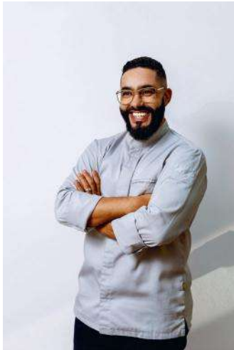
Bild 13 Autorenporträt I