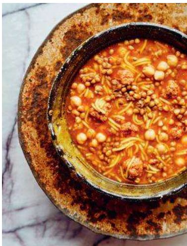
Bild 7 Seite 86 Blitzschnelle Harira