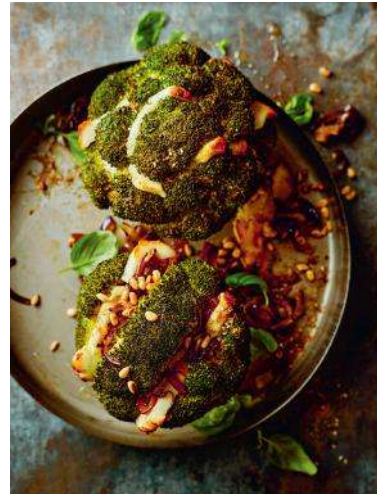
Bild 10 Seite 144 Brokkoli mit Halloumifüllung