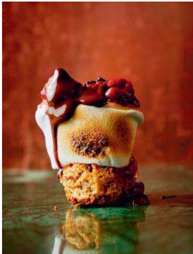
Bild 11 Seite 157 S'mores mit Pflaumenmus