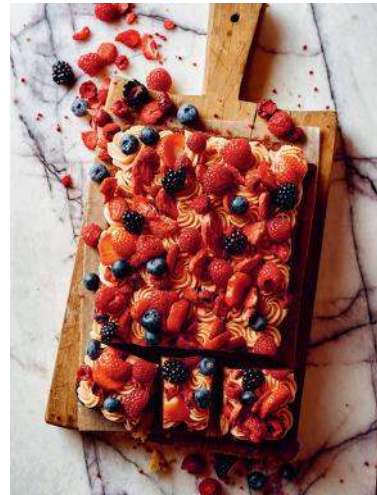
Bild 12 Seite 161 Mandel-Mohnbiskuit mit Himbeercreme