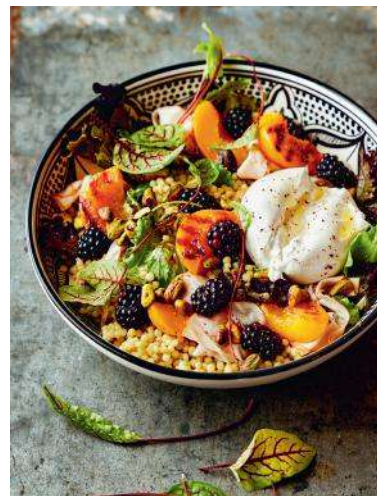
Bild 8 Seite 93 Perl-Couscous-Salat mit gegrillten Pfirsichen