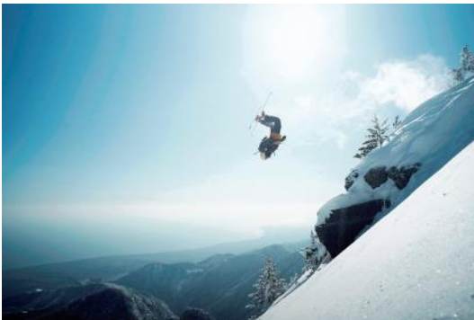
Bild 3 Seite 26 Unberührter Pulverschnee, das Meer im Hintergrund. Besser hätte das Timing nicht sein können. Max und Jochen haben einen perfekten Tag am Olymp erwischt.