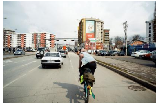
Bild 4 Seite 86 Die Einfahrt nach Prizren (Kosovo) fühlt sich erfrischend an, nach den kleinen Bergstraßen der letzten zwei Wochen. Hier tobt das Leben.