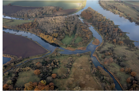
Bild 6 Seite 73 Saalemündung