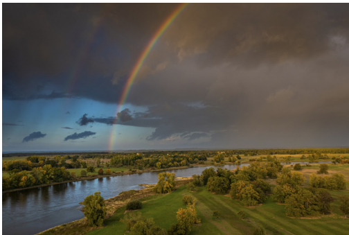
Bild 19 Seite 203 Elbe Regenbogen