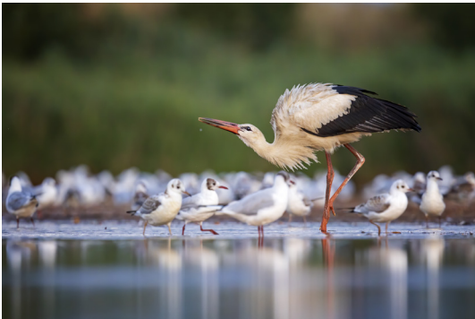
Bild 13 Seite 127 Weißstorch