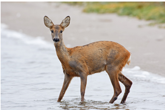
Bild 15 Seite 133 Reh