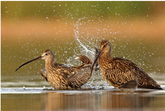
Bild 17 Seite 163 Brachvogel