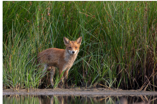
Bild 14 Seite 132 Fuchs