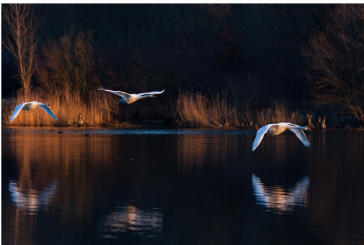
Bild 7 Seite 82 Höckerschwan