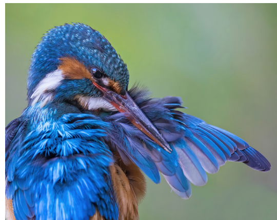
Bild 8 Seite 87 Eisvogel