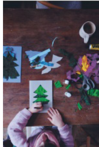
Bild 10 Seite 122 Tannenbaumpost