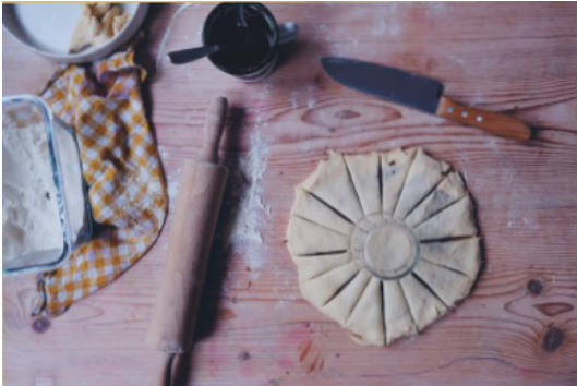
Bild 5 Seite 20 Hefe-Sternflocke