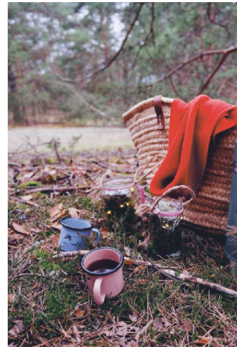
Bild 8 Seite 34 Elfen-Lichter