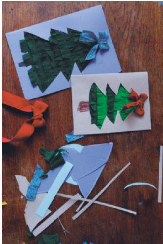
Bild 11 Seite 123 Tannenbaumpost