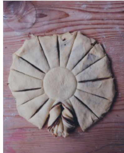
Bild 6 Seite 21 Hefe-Sternflocke