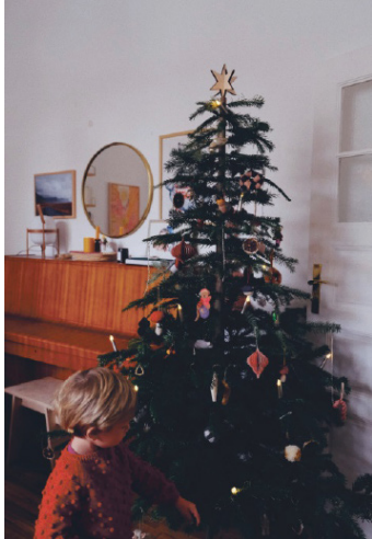
Bild 9 Seite 72 Weihnachtsbaum