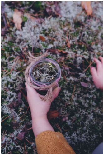
Bild 7 Seite 33 Elfen-Lichter