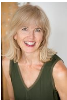
Laguna Beach in Kalifornien.

Als sie sich lauthals beschwert, soll sie Entschuldigungsbriefe schreiben. Und als ob das noch nicht genug wäre, fährt der Bruder auch noch ins Ferienlager und lässt die Schwester sich um die gruselige Echse kümmern.