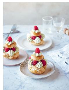
Bild 9 Seite 74 Windbeutel mit Pistazien- creme und Himbeeren