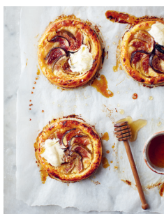
Bild 2 Seite 18 Tartes mit Mandelcreme und Feigen