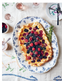
Bild 5 Seite 35 Galette mit Früchten