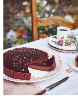
Bild 12 Seite 99 Schokoladentarte mit Meersalz