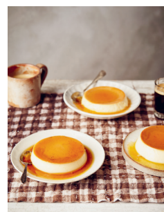
Bild 3 Seite 23 Crème Caramel