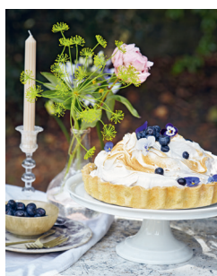
Bild 4 Seite 31 Blaubeer-Baiser-Tarte