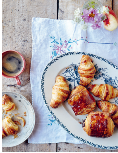
Bild 10 Seite 86 Croissants und Pains au Chocolat