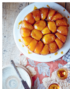
Bild 7 Seite 56 Mamans Tarte Tatin