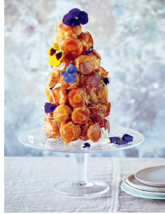
Bild 11 Seite 91 Mini Croque en Bouche