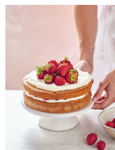
Bild 6 Seite 55 Französische Erdbeertorte