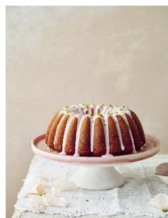
Bild 8 Seite 62 Pistazienkuchen mit Rosen- aroma