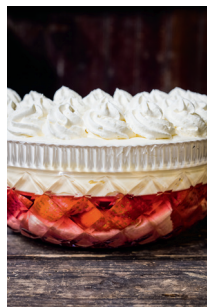
Bild 4 Seite 166 Erdbeer- und Sherry Trifle