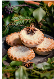
Bild 2 Seite 91 Highclere Mince Pies