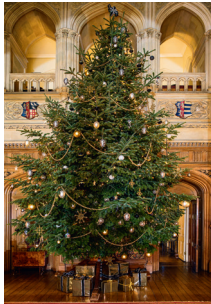
Bild 1 Seite 72 Der Weihnachtsbaum im Salon des Schlosses