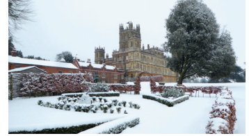
Bild 3 Seite 165 Winter auf Highclere Castle