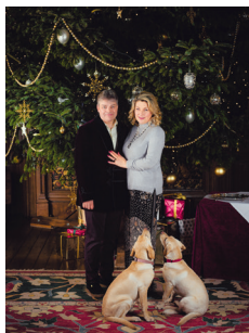
Bild 7 Seite 314 George Herbert, der 8. Earl von Carnarvon und Lady Fiona Carnarvon