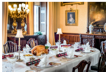
Bild 5 Seite 168-169 Es ist angerichtet: Das Weihnachtsessen auf Highclere Castle