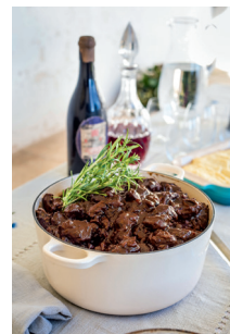
Bild 6 Seite 229 Boxing Day Beef Stew - Rinderragout am Weih- nachtstag