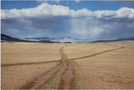
Bild 17 Nordmongolei, 2018