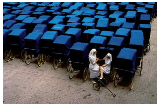
Bild 8 Lourdes, Frankreich, 1989