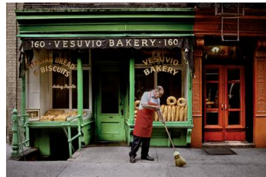
Bild 20 New York City, New York, USA, 1996