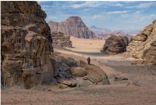
Bild 13 Wadi Rum, Jordanien, 2019