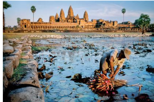
Bild 6 Angkor Wat, Kambodscha, 1997