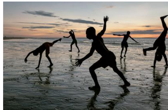
Bild 16 Belo sur Mer, Morondava, Madagaskar, 2019