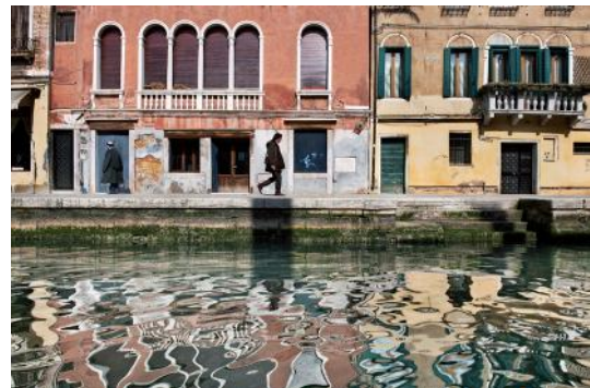
Bild 12 Venedig, Italien, 2011