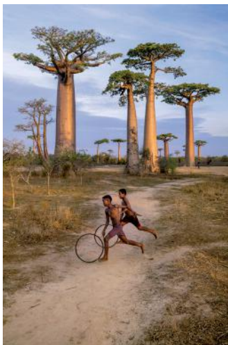
Bild 15 Morondava, Madagaskar, 2019