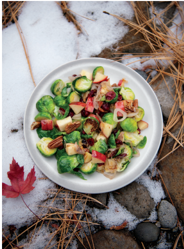
Bild 9 Seite 125 Bunte Rosenkohlpfanne