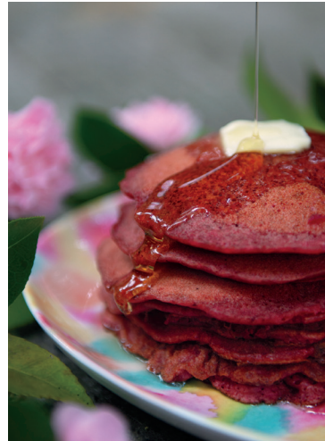
Bild 10 Seite 141 Pink Pancakes