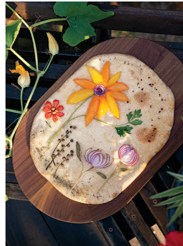
Bild 8 Seite 117 Florale Foccacia