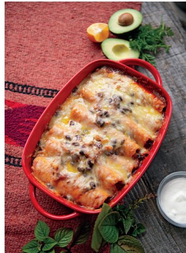
Bild 12 Seite 163 Enchiladas mit Walnüssen