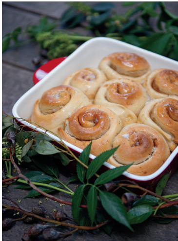
Bild 11 Seite 151 Zimtrollen