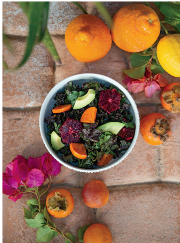
Bild 7 Seite 93 Fruchtig-pikanter Salat