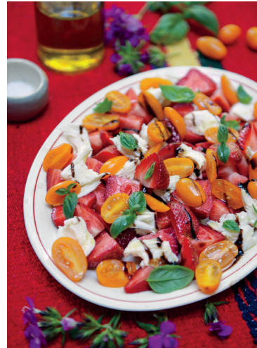
Bild 6 Seite 85 Erdbeer-Caprese