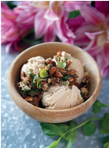
Bild 15 Seite 223 Vanilleeis mit Datteln und Mandeln