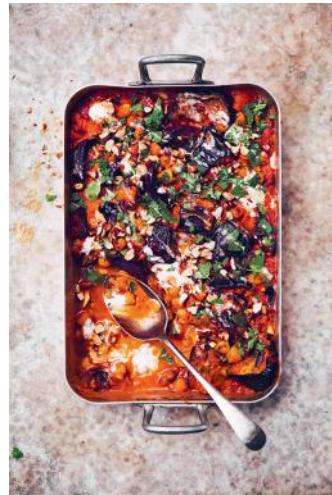
Bild 8 Seite 150 Slow: Geschmorte Auberginen + Kicherer- bsen in Harissa-Tomatensauce