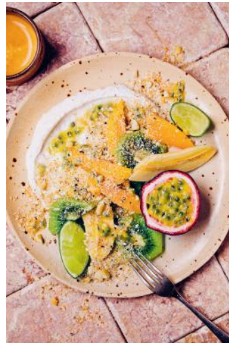
Bild 2 Seite 73 Quick: Sonnenscheinsalat mit Kokosmus + Kokos-Dukkah