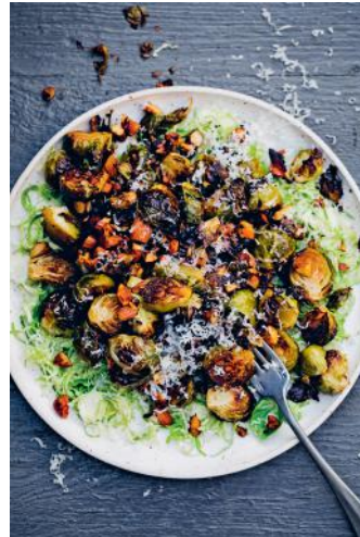
Bild 10 Seite 204 Quick: Gerösteter Rosenkohl mit Orangen-Marinade + Mandeln