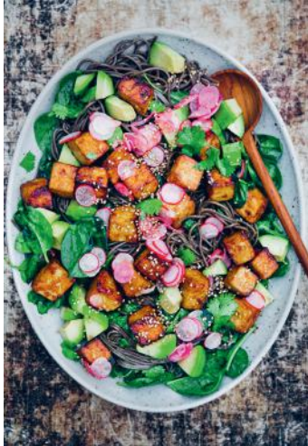
Bild 5 Seite 125 Quick: Ingwer-Soba-Salat mit Kurkuma-Tofu + eingelegte Radieschen