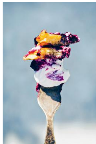
Bild 4 Seite 91 Quick: Luftige Kokos-Pfannkuchen