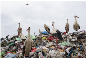
Bild 13 Seite 130-131 Störche auf Mülldeponie