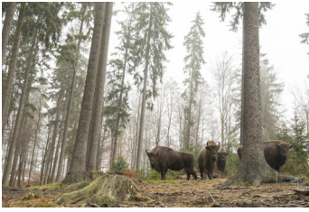
Bild 10 Seite 100-101 Wisentherde