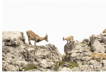
Bild 20 Seite 186 Steingeißen