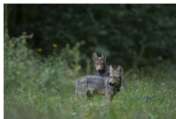
Bild 17 Seite 158-159 Wölfe