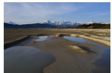
Bild 18 Seite 176 Forgensee