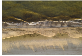
Bild 11 Seite 118-119 Ostseestrand