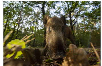
Bild 15 Seite 153 Wildschwein im Tegeler Forst