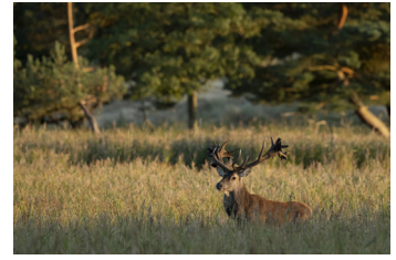
Bild 12 Seite 120 Hirsch in Ostseenational- park