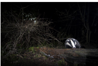
Bild 16 Seite 156 Dachs bei Nacht