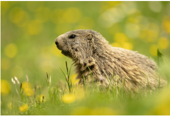
Bild 19 Seite 182 Murmeltier