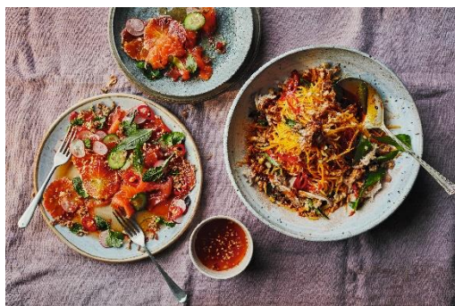
Bild 03 Seite 42 + 43 Blutorangensalat mit Räucherlachs Mango-Steckrübensalat mit Krebsfleisch