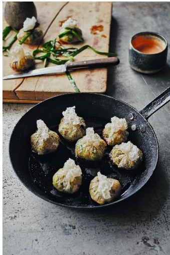
Bild 08 Seite 128 Dumplings in Reispapier

Gegrillte Hackfleisch-Wraps und Fischsauce mit Ananas