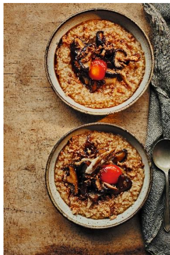
Bild 02 Seite 37 Reispottage mit Räuchermakrele und Pilzen