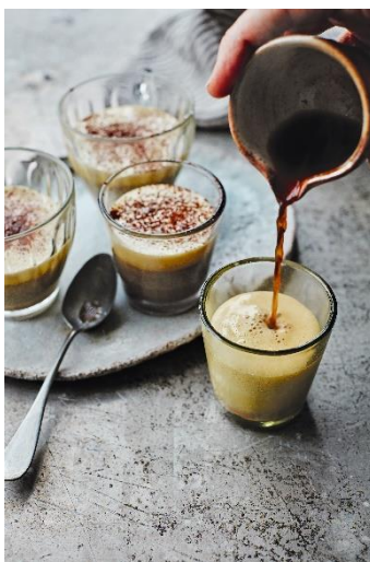
Bild 09 Seite 167 Eierkaffee aus Hanoi