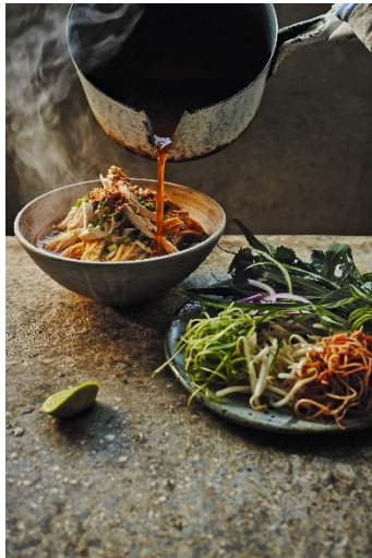
Bild 01 Seite 22 Bún Gà Huê