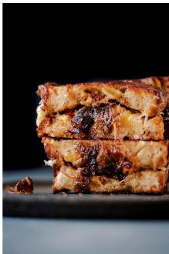
Bild 03 Seite 48 Grilled Cheese Sandwich