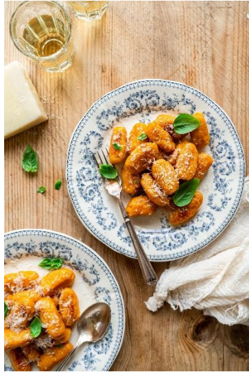
Bild 13 Seite 245 Süßkartoffel-Gnocchi