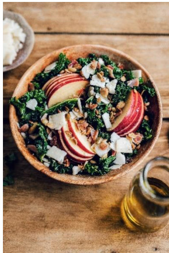
Bild 02 Seite 38 Grünkohlsalat mit Apfel, Bacon und Parmesan