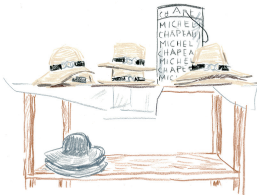
Bild 9 Seite 180 Die Firma Michel besitzt über 4000 Hutformen.