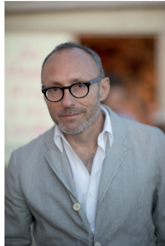
Bild 10 Illustrator Jean-Philippe Delhomme