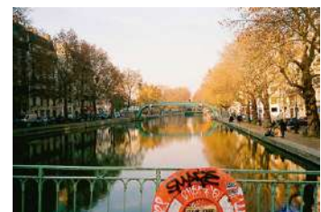
Bild 18 Seite 219 Am Canal St. Martin