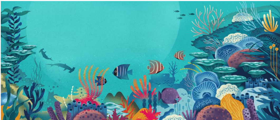
Bild 14 Seite 77 Der Anemonenfisch