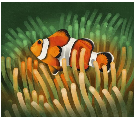
Bild 15 Seite 80 Meeresverschmutzung I