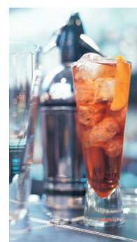
Bild 9 Seite 47 Americano ...ist der erste Cocktail, der in den Bond-Büchern genannt wird.