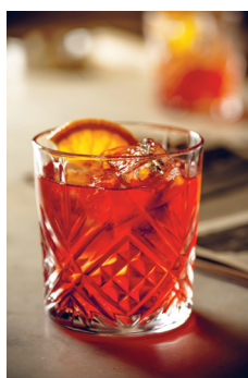
Bild 5 Seite 30 Negroni In Feuerball belohnt sich Bond mit einem Negroni, nachdem er einen Schurken entwaﬀnet hat.