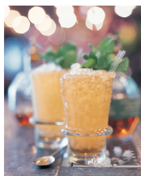
Bild 7 Seite 44 Mint Julep Erzfeind Auric Goldfinger bietet seinem Gefangenen James Bond einen Mint Julep an.