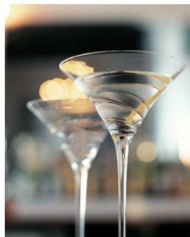
Bild 2 Seite 12 Klassischer Martini