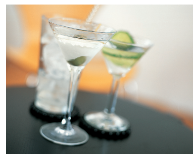
Bild 3 Seite 15 Wodka Martini