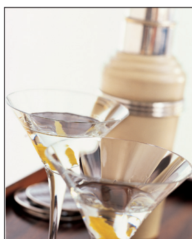
Bild 4 Seite 16 Vesper „Dieser Cocktail ist meine eigene Erfindung. Ich werde ihn patentieren lassen, sobald mir ein guter Name eingefallen ist.“ - James Bond, Casino Royale