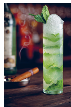
Bild 6 Seite 43 Mojito In Stirb an einem anderen Tag bietet Bond Jinx einen Schluck von seinem Mojito an.