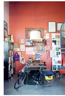
Bild 15 Seite 153 Kate Bingaman-Burt , Illustratorin und Kunsterzieherin (Portland, USA)