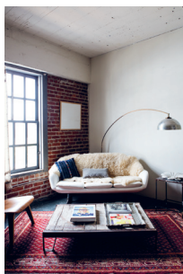
Bild 1 Seite 27 Sarah Owens , Künstlerin und Interior Designerin (San Francisco, USA)