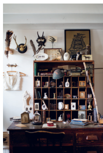
Bild 2 Seite 39 Alix Blüh , Schmuckdesignerin (San Francisco, USA)