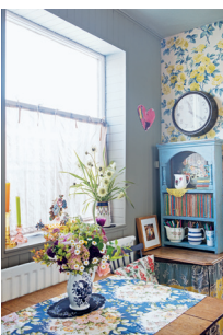
Bild 7 Seite 73 Vicky Trainor , Textilkünstlerin (Northumberland, England)