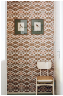
Bild 13 Seite 143 Maartje van den Noort , Illustratorin (Amsterdam, Niederlande)