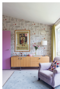
Bild 9 Seite 99 Sarah Hamilton , Künstlerin und Designerin (London, England)