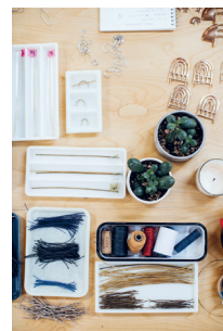
Bild 3 Seite 52 Teresa Robinson , Schmuck- designerin (Portland, USA)