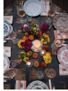
Bild 12 Seite 147 Eine Ansammlung saisonaler Produkte, kombiniert mit Kerzen & Blumen, ergibt eine schöne Tischdeko.