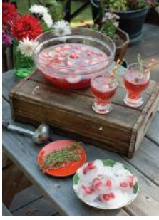
Bild 10 Seite 123 Beeren-Thymian-Bowle