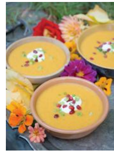
Bild 15 Seite 189 Süßkartoffelcremesuppe