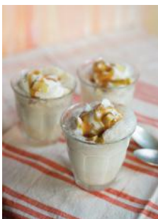
Bild 16 Seite 195 Cidre Floats