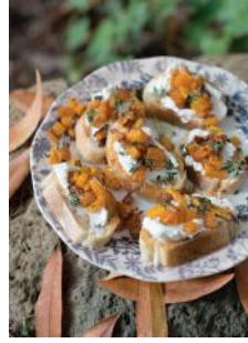
Bild 11 Seite 137 Crostini mit Kürbis & Ziegenkäse