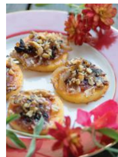
Bild 18 Seite 209 Polenta-Pizzas