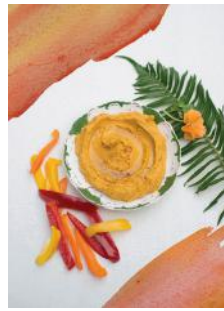
Bild 14 Seite 173 Butternuss-Hummus