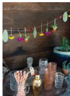
Bild 17 Seite 198 Kurzstielige Blumen, Cranberrys & Blätter an einem Küchengarn befestigt, werden zu einer schönen Blumengirlande.