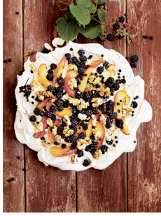
Bild 10 Seite 203 Brombeer-Apfel-Baiser mit Walnüssen und Holunderbee- ren