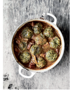
Bild 12 Seite 246 Wildragout mit Brennnesselknödeln