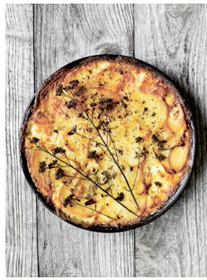
Bild 14 Seite 263 Gratin mit trocken gepökel- tem Seelachs, Kartoffeln, Crème double und Majoran