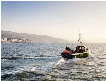
Bild 13 Seite 250-251 Von den Fischern am Hafen bekommt Gill Meller Fisch und Meeresfrüchte für seine Gerichte.