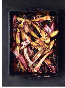
Bild 11 Seite 207 Gebratene Pastinaken mit Brombeeren, Honig, Radicchio und Roggenflocken