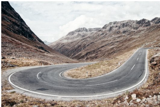
Bild 2A Seite 106 Timmelsjoch im Sommer Ötztaler Alpen, Tirol Österreich, 2014/2015