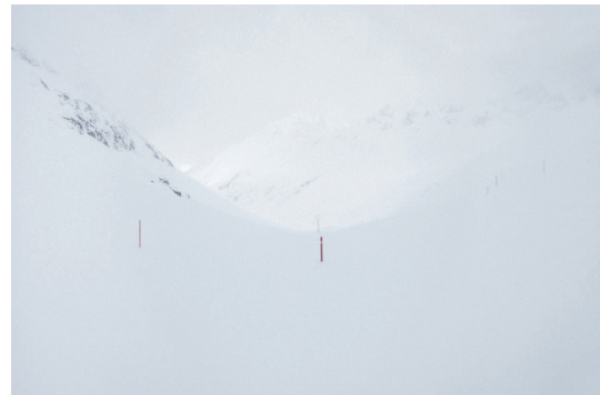
Bild 2B Seite 107 Timmelsjoch im Winter Ötztaler Alpen, Tirol Österreich, 2014/2015