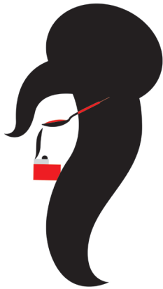
Bild 13 Seite 281 Amy Winehouse , 2006