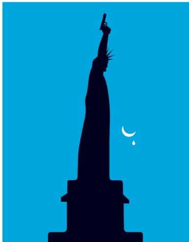
Bild 15 Seite 344 Deadly Rhetoric (Mörderische Rhetorik) für Aeon, Juni 2014

Copyright: 2017 Noma Bar/Knesebeck Verlag