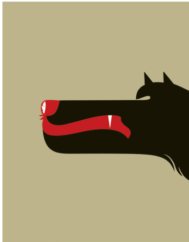
Bild 7 Seite 113 Beware of the Wolves (Nimm dich in Acht vor den Wölfen), für GQ , Siebdruck 2008