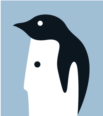
Bild 5 Seite 63 Out in the Cold (Kalt erwischt) für GQ France, September 2011