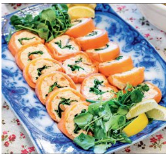
Bild 16 Seite 100 Räucherlachs-Roulade