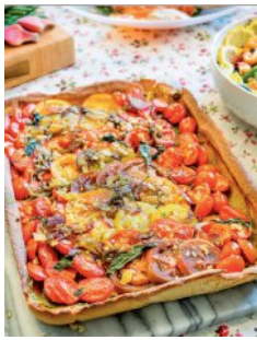
Bild 13 Seite 97 Heritage Tomato Tart