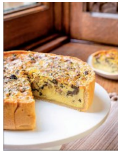
Bild 24 Seite 188 Quiche mit Pilzen und Gruyère