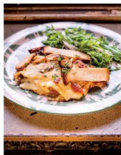
Bild 27 Seite 216 Wildpilzlasagne