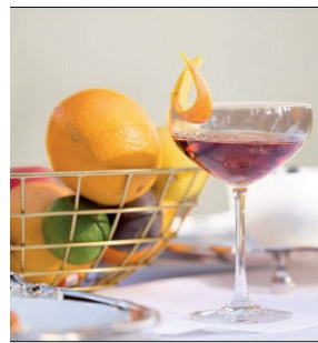
Bild 5 Seite 26 The Hanky Panky