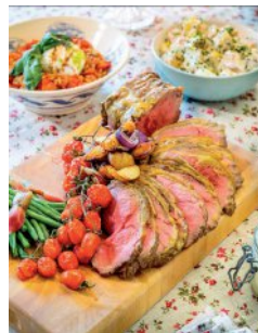
Bild 17 Seite 102 Roast beef Salat mit haus- gemachtem Meerrettich