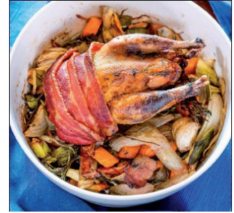
Bild 30 Seite 301 Gebratener Fasan mit geräuchertem Schinken