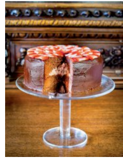
Bild 21 Seite 152 Schokoladenkuchen mit Sahne und Erdbeeren