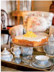
Bild 10 Seite 78 Ananas Kuchen mit Vanille- glasur