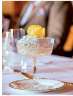
Bild 20 Seite 144 Lemon Syllabub