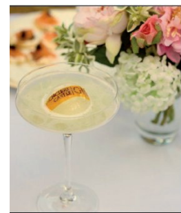
Bild 6 Seite 27 The Lordship Cocktail