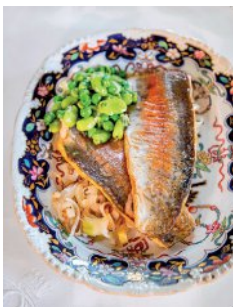
Bild 7 Seite 62 Gebratene Forelle mit Erbsen