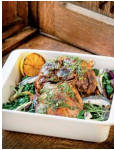
Bild 19 Seite 141 Slow baked Lamm mit Anchovis