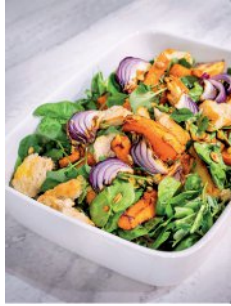
Bild 29 Seite 286 Wintersalat mit Honig