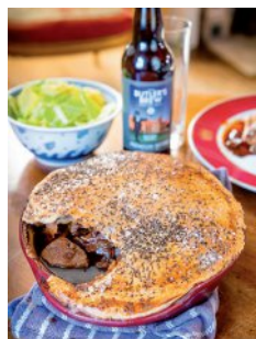
Bild 26 Seite 214 Beer simmered Beef pie