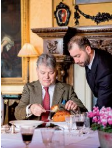
Bild 31 Seite 310 Lord Carnavons marmalade pudding

Copyright: Highclere Enterprises LLP/Knesebeck Verlag