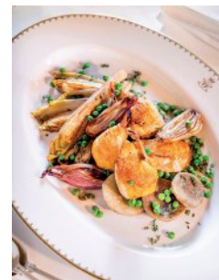
Bild 9 Seite 74 Hühnchen mit Erbsen und Salat