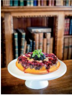
Bild 28 Seite 228 Gestürzter Brombeerkuchen