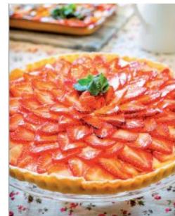
Bild 18 Seite 104 Tarte aux fraises