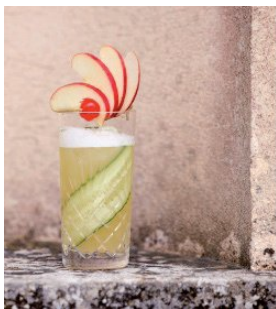
Bild 4 Seite 25 The English Garden