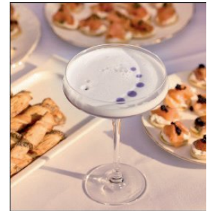
Bild 3 Seite 24 The Lavender Lady