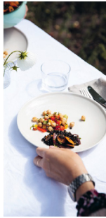
Bild 10 Seite 69 Kichererbsensalat