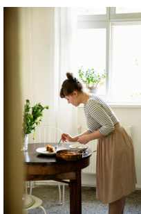
Bild 5 Seite 31 Zucchini-Türmchen