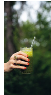
Bild 15 Seite 121 Wildkräuter-Smoothie