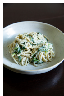
Bild 3 Seite 27 Spaghetti mit Spinat-Cas- hew-Sauce