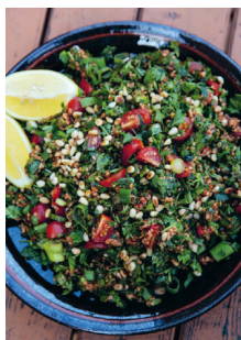
Bild 16 Seite 133 Tabouleh