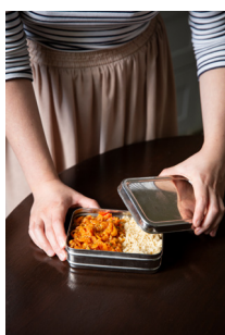
Bild 4 Seite 29 Linsen-Gemüse-Ragout