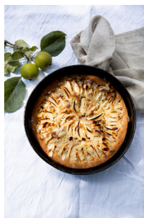
Bild 17 Seite 147 Apfel-Marzipan-Kuchen