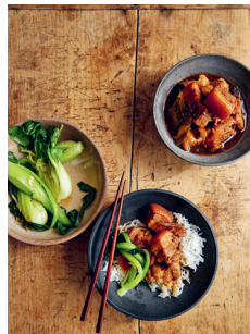
Bild 5 Seite 137 Rot geschmorter Schweine- bauch mit Honig