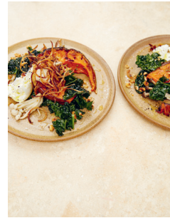
Bild 3 Seite 107 Gerösteter Kürbis mit Palm- kohl, Burrata, eingelegten Pilzen und Röstzwiebeln