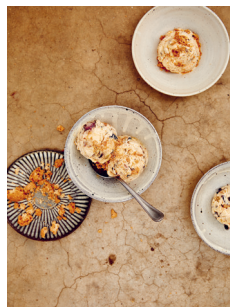
Bild 8 Seite 221 Amarettoeis mit Honigfeigen