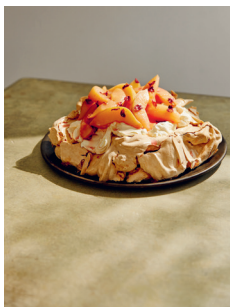
Bild 7 Seite 202 Haselnussbaiser mit Ho- nig-Mascarpone und Quitten