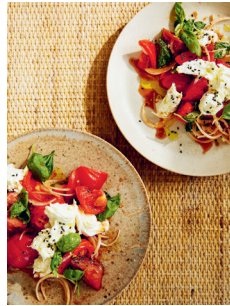
Bild 2 Seite 84 Tomaten mit Limette, Honig und schwarzem Knoblauch