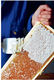
Bild 1 Seite 21 Honeycomb