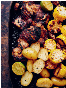
Bild 4 Seite 127 Honig-Limetten-Hähnchen mit Kartoffeln und Mais