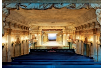
Bild 29 Seite 167 Slottsteater, Drottningholm/Schweden