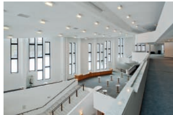
Bild 03 Seite 16 Aalto-Musiktheater, Essen/Deutschland