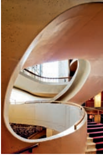
Bild 19 Seite 113 Metropolitan Opera House, New York City/USA