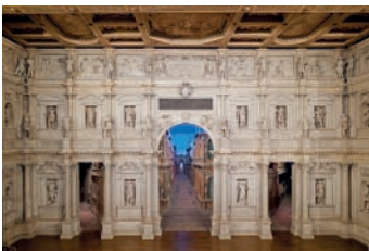
Bild 31 Seite 195 Teatro Olimpico, Vicence/Italien