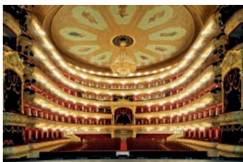
Bild 04 Seite 21 Bolschoi Theater, Moskau/Russland