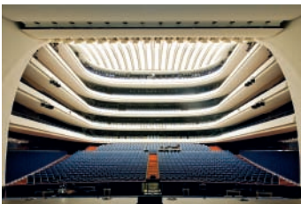
Bild 25 Seite 148 Palau de les Arts Reina Sofia, Valencia/Spanien