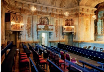
Bild 28 Seite 164 Slottsteater, Drottningholm/Schweden