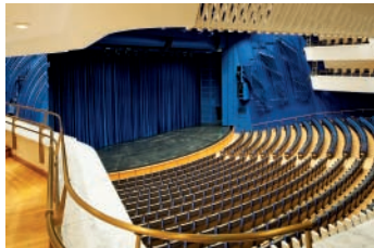
Bild 02 Seite 14 Aalto-Musiktheater, Essen/Deutschland