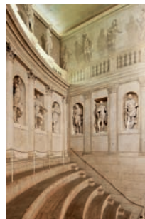
Bild 32 Seite 196 Teatro Olimpico, Vicence/Italien