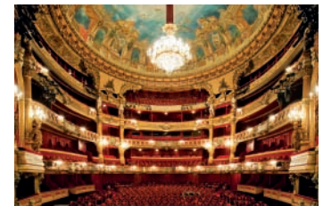
Bild 33 Seite 226 Théâtre Royal de la Monnaie, Brüssel/Belgien