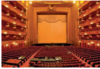
Bild 20 Seite 115 Metropolitan Opera House, New York City/USA