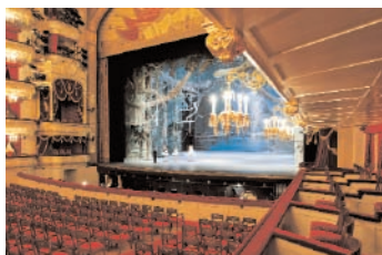
Bild 05 Seite 25 Bolschoi Theater, Moskau/Russland