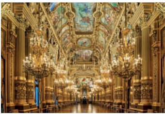
Bild 22 Seite 139 Palais Garnier, Paris/Frankreich