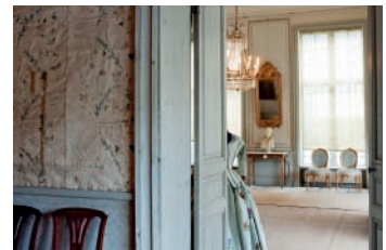
Bild 27 Seite 162 Slottsteater, Drottningholm/Schweden