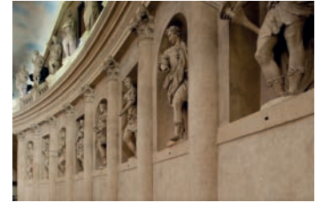
Bild 30 Seite 192 Teatro Olimpico, Vicence/Italien