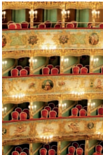
Bild 13 Seite 73 La Fenice, Venedig/Italien