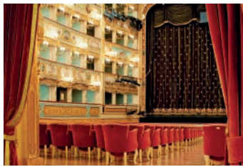
Bild 14 Seite 75 La Fenice, Venedig/Italien