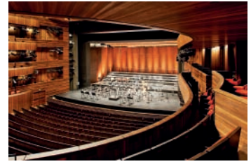
Bild 12 Seite 52 Den Norske Opera og Ballett, Oslo/Norwegen