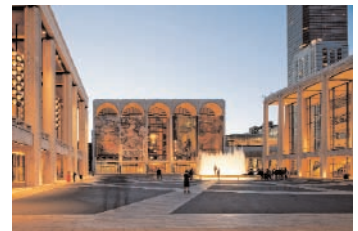
Bild 18 Seite 110 Metropolitan Opera House, New York City/USA