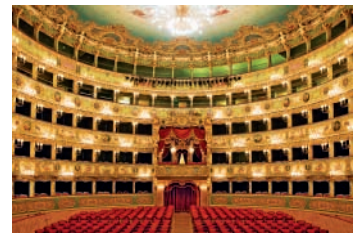
Bild 15 Seite 78 La Fenice, Venedig/Italien