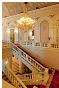
Bild 06 Seite 27 Bolschoi Theater, Moskau/Russland