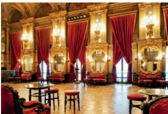
Bild 34 Seite 226 Théâtre Royal de la Monnaie, Brüssel/Belgien