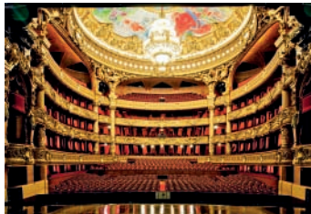
Bild 23 Seite 142 Palais Garnier, Paris/Frankreich