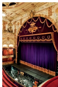
Bild 09 Seite 42 Coliseum, London/Großbritannien