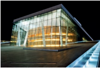
Bild 10 Seite 48 Den Norske Opera og Ballett, Oslo/Norwegen