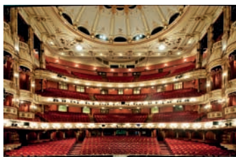
Bild 08 Seite 39 Coliseum, London/Großbritannien