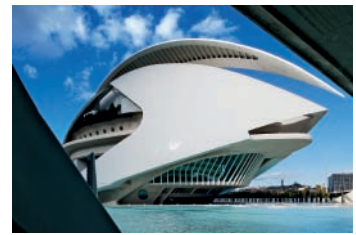
Bild 24 Seite 147 Palau de les Arts Reina Sofia, Valencia/Spanien