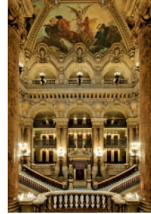
Bild 21 Seite 137 Palais Garnier, Paris/Frankreich