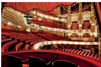
Bild 07 Seite 39 Coliseum, London/Großbritannien