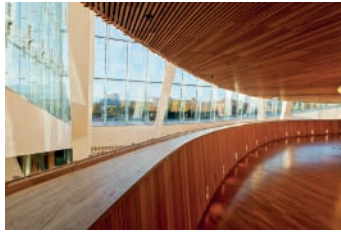
Bild 11 Seite 49 Den Norske Opera og Ballett, Oslo/Norwegen