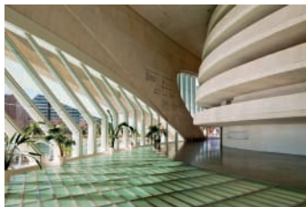
Bild 26 Seite 151 Palau de les Arts Reina Sofia, Valencia/Spanien