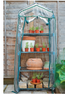
Bild 3 Seite 41 Gute Idee fürs Spargärtchen: ein Minigewächshaus, hier mit Sämlingen