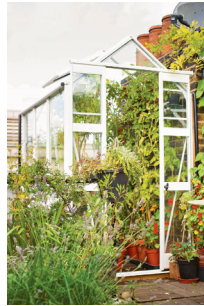
Bild 2 Seite 24 Über den Dächern Londons: auf 5x6 Metern hat die Besitzerin Wendy mehrere Beete, einen Kompost und sogar ein Gewächshaus, in dem das ganze Jahr Tomaten reifen.