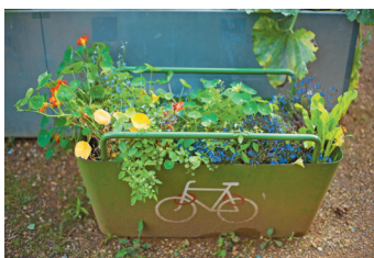
Bild 7 Seite 52 Garten voller guter Ideen: Im Gemeinschaftsgarten im Londoner Stadtteil Islington werden u.a. Fahrradständer begrünt.