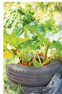
Bild 8 Seite 68 Rhabarber wächst auch gut in einem alten Reifen - hier in einem Garten für Vorschulkinder.