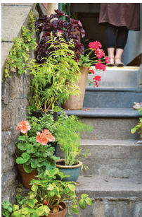
Bild 4 Seite 44 Kräuter und Geranien mögen es sonnig: hier wachsen sie Seite an Seite auf einem Treppenaufgang.