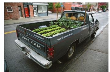
Bild 9 Seite 95 Auf der Suche nach einer geeigneten Anbaufläche in New York City wurde Ian erfinderisch: er nutzt seinen alten Dodge Pick-up.