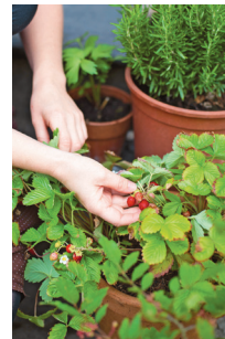
Bild 5 Seite 47 Auch kleine, genussvolle Walderdbeeren reifen an der sonnigen Treppe.