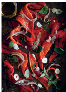
Bild 2 Seite 53 Marinierte und gebratene Paprikaschoten mit Anchovis