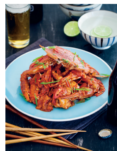
Bild 6 Seite 130 Chilikrabben á la Singapur