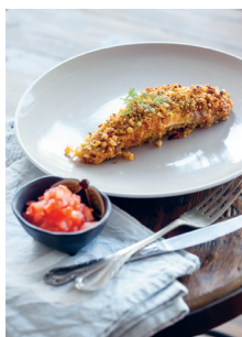
Bild 4 Seite 106 Fisch mit indischer Gewürz- kruste