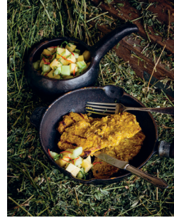
Bild 12 Seite 211 Schweinekotelett mit Zitronengras und Kurkuma