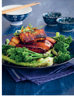
Bild 11 Seite 194 Chinesischer glasierter Schweinebauch