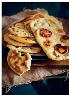
Bild 1 Seite 35 Naan-Brot