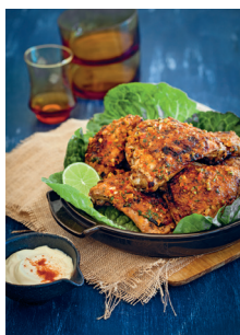
Bild 7 Seite 166 Peri-Peri-Hähnchen