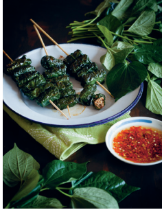
Bild 10 Seite 188 Gegrilltes Rind in Betelblättern