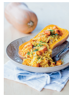
Bild 3 Seite 58 Mit Biryani gefüllter Kürbis