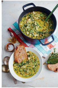
Bild 11 Seite 197 Ribollita aus dem Latium