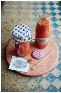
Bild 13 Seite 255 Tomatensauce auf Vorrat für Pizza & Pasta