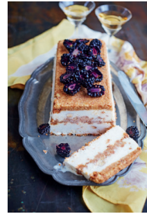
Bild 12 Seite 236 Mandeleistorte mit süßem Wein