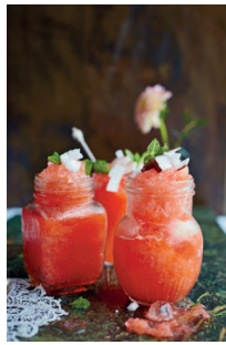
Bild 14 Seite 277 Römische Granita