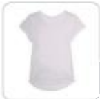
| weißes T-Shirt