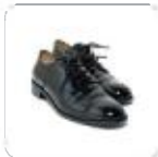
| schwarze Halbschuhe