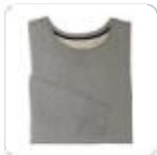
| graues Sweatshirt