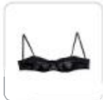
| schwarzer BH