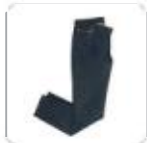
| Raw Denim Jeans