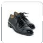
| schwarze Halbschuhe