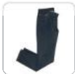
| Raw Denim Jeans