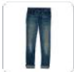
| blaue Jeans