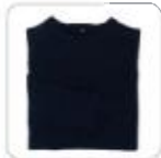
| schwarzer Pullover