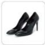
| hohe Pumps