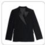
| schwarze Smokingjacke