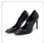
| hohe schwarze Pumps