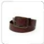
| dunkelbrauner Gürtel