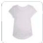
| weißes T-Shirt