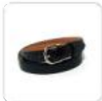
| schwarzer Gürtel