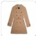
| beigefarbener Trenchcoat