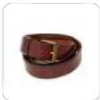
| dunkelbrauner Gürtel