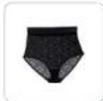
| schwarzer höflicher Slip