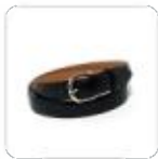
| schwarzer Gürtel