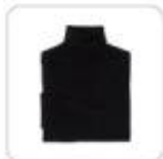
| schwarzer Rollkragenpullover