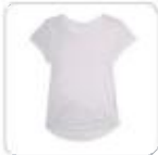
| weiÙes T-Shirt