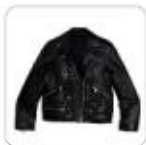
| schwarze Lederjacke