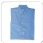
| bbvues Hemd