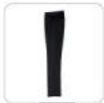
| schwarze Hose