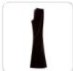
| Hose mit hohem Bund