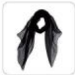
| schwarzes Halstuch