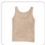
| Ärmelloses Top