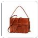
| braune Fransen Tasche