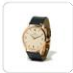
| klassische Armbanduhr