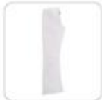
| weiße Jeans