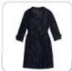
| schwarzer Trenchcoat