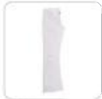
| weiÙe Jeans