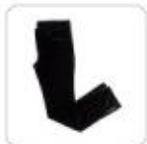
| schwarze Cordhose