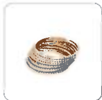
| Stroh- und Gold-Armreifen