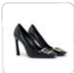
| hohe Pumps