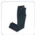
| Rivar Denim Jeans