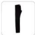
| schwarze Jeans