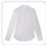
| weißes Hemd