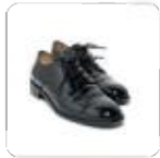
| schwarze Halbschuhe