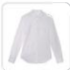
| weißes Hemd