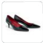
| halbhohle schwarze Pumps