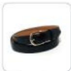
| schwarzer Gürtel