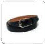
| schwarzer Gürtel