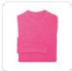
| pinkfarbener Pullover