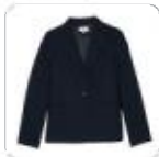
| dunkelblauer Blazer