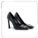
| hohe Pumps