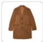
| beigefarbener Mantel im Herrenschnitt