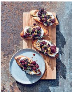
Bild 16 Seite 152 Zitronen-Ricotta-Crostini mit gebackenen Weintrauben