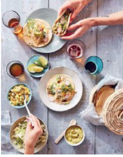
Bild 10 Seite 104 Fishtacos mit mariniertem Kohl und Ananassalsa