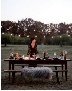
Bild 19 Seite 199 Herbsttisch