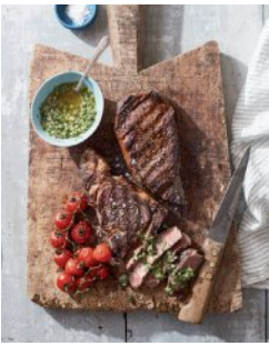
Bild 13 Seite 125 Rib-Eye-Steak mit gebratenen Tomaten und Chimi- churri