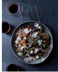
Bild 20 Seite 224 Farrosalat mit gerösteten Süßkartoffeln, roten Zwie- beln und Ziegenkäse