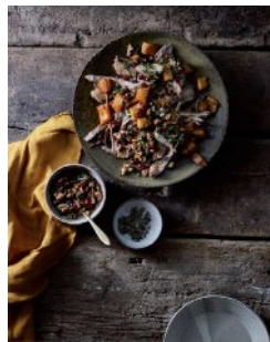
Bild 17 Seite 183 Schweineschmortopf mit Butternusskürbis und Wal- nussgremolata