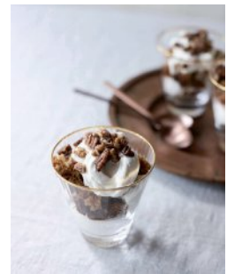
Bild 18 Seite 195 Karottenkuchen-Trifle mit Mascarpone und Pekannüssen