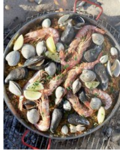
Bild 11 Seite 110 Meeresfrüchtepaella vom Grill