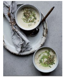
Bild 15 Seite 151 Cremige Blumenkohlsuppe mit Dukkah und Brunnen- kressepesto