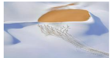
Bild 6 Tiere in ihrem Lebensraum Shangzhen Fan (China): „Nomaden des Schneeplateaus“