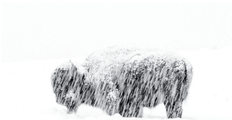
Bild 4 Natur in Schwarz-Weiß Max Waugh (USA): „Vom Schnee verweht“