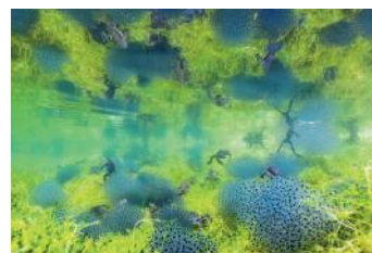
Bild 8 Verhalten - Amphibien und Reptilien Manuel Plaickner (Italien): „Teichkosmos“