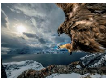
Bild 7 Verhalten - Vögel Audun Rikardsen (Norwegen): „Land des Adlers“