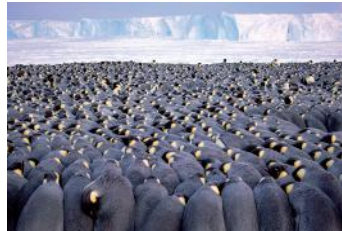
Bild 2 „Naturfotograf des Jahres“-Portfoliopreis Stefan Christmann (Deutschland): „Aneinandergeschmiegt“