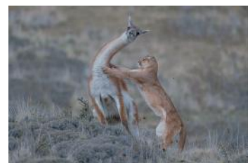
Bild 9 Verhalten - Säugetiere Ingo Arndt (Deutschland): „Ausgeglichener Kampf“