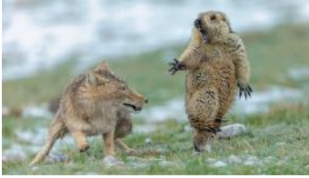
Bild 1 Kategorie Naturfotograf des Jahres 2019 Yongqing Bao (China): „Ein Augenblick von Leben und Tod“