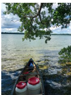
Bild 1 Seite 28 Schleswig-Holstein, Schwentine Drei Tage Kanutour auf der Schwentine. Rastplatz am Behler See