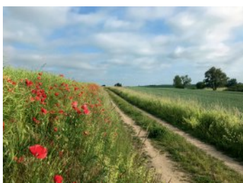
Bild 7 Seite 83 Brandenburg, Uckermark Ein Tag Weltflucht in der Schorfheide Chorin.