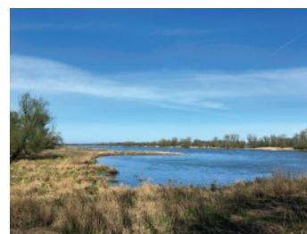
Bild 6 Seite 79 Niedersachsen, Wendland an der Elbe Links das Wendland, rechts Brandenburg, auf einer Radtour kann man beides verbinden.