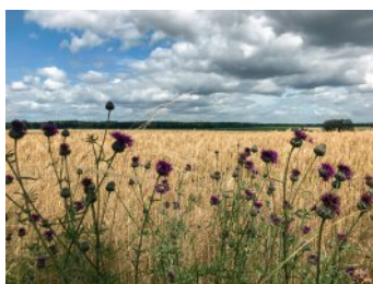
Bild 8 Seite 85 Havel, Rheinsberger Seengebiet und Neuruppiner Seenland Vier Tage mit dem Rad an der Havel entlang und immer wieder durch die Brandenburger Weite.