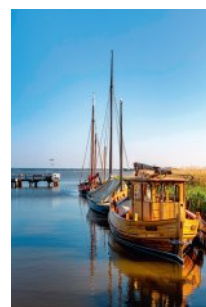
Bild 3 Seite 40 Mecklenburg-Vorpommern, Ostsee, Fischland-Darß-Zingst Der Bodden war mit seinen versteckten Buchten früher ein beliebtes Revier für Piraten und Schmuggler. Heutzutage ist alles friedlich.