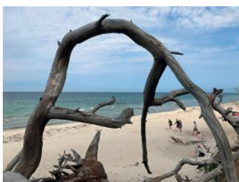
Bild 4 Seite 43 Mecklenburg-Vorpommern, Ostsee Fischland-Darß-Zingst Der Darßer Weststrand ist nur mit dem Rad oder zu Fuß zu erreichen. Entsprechend wenige Menschen sind unterwegs.