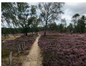
Bild 5 Seite 53 Hamburg, Fischbeker Heide Eine halbe Stunde S-Bahnfahrt vom Stadtzentrum entfernt: Blütezeit in der Fischbeker Heide, südlich der Hansestadt.