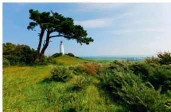
Bild 2 Seite 39 Mecklenburg-Vorpommern, Hiddensee Das Licht vom Leuchtturm Dornbusch reicht 45 Kilometer in die Ostsee hinaus. Zur Besichtigung bis Windstärke 6 geöffnet.